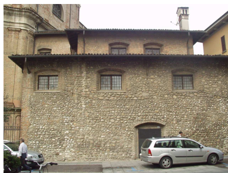
Vista generale della sacrestia