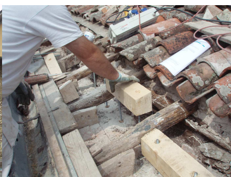
Esempio di realizzazione del cordolo