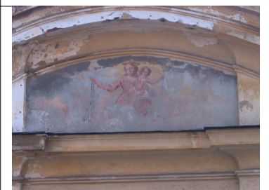
Il dipinto in S. Lorenzo