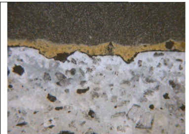
Immagine al microscopio ottico