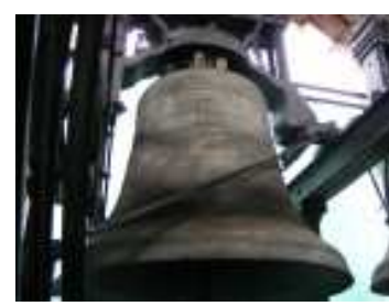
Le campane dopo la pulizia