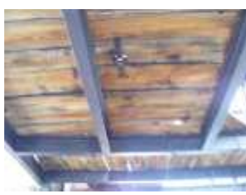
L'assito dopo i lavori