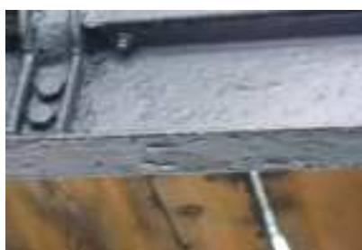
Il castello dopo i lavori