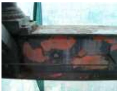
Il degrado del castello