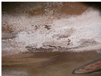
Perdita del dipinto per i sali